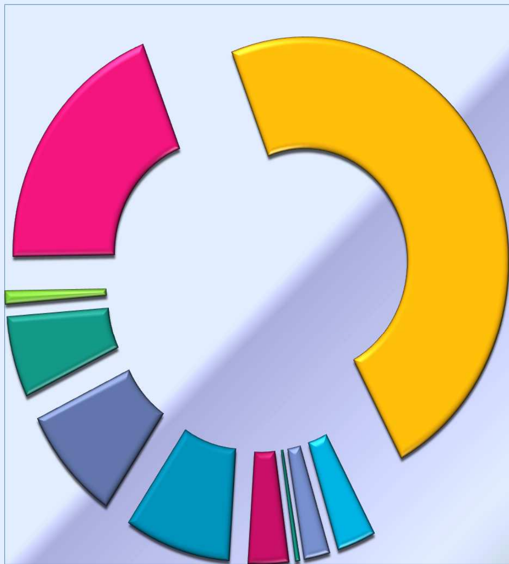
Broj aktivnih osiguranika